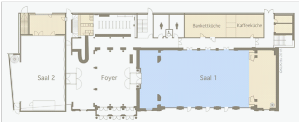
Saal 2 Vorträge