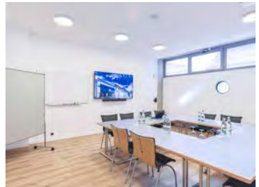
Kursraum 1 + 2 (zusammengelegt) Delegiertenversammlung SAG - SAS